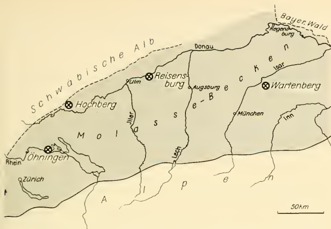
Abb. 2: Andrias -Fundpunkte im süddeutschen Molassebecken (Beckenränder nach STEPHAN 1964)

Tübingen, Am 1117/6) zeigt vor allem die Zahnriemen am Innenrand des Kiefers. Nach der Datierung der Graupensande als Helvet ist dies der stratigraphisch älteste Beleg von Andrias im Bereich des süddeutschen Molassebeckens.